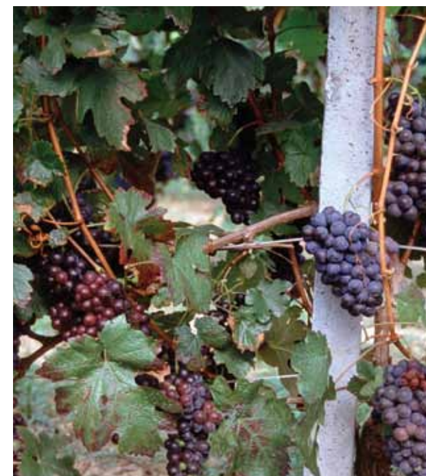
Effetto "traslucido" causato da un prodotto rameico penetrante