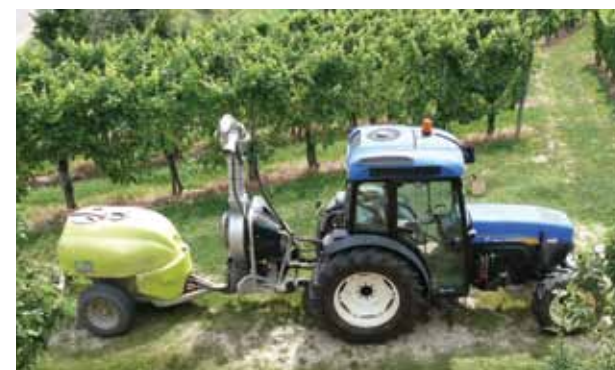
(E) - Atomizzatore a basso volume portato dal trattore, seguito dal carro botte. Questa soluzione facilita la maneggevolezza e le sterzate (VMA)