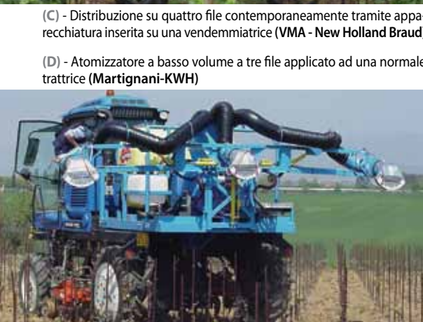
(C) - Distribuzione su quattro file contemporaneamente tramite apparecchiatura inserita su una vendemmiatrice (VMA - New Holland Braud)