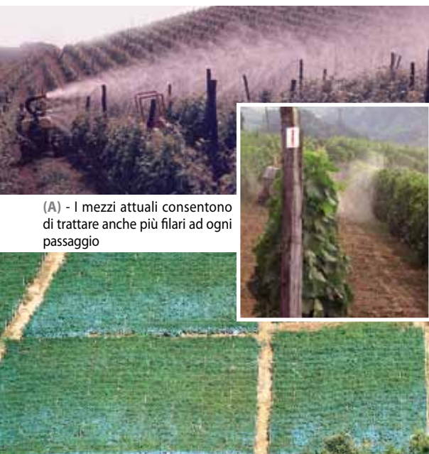
(A) - I mezzi attuali consentono di trattare anche più filari ad ogni passaggio