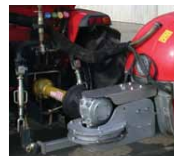
(F) - Sistema sterzante particolare che consente di far lavorare il giunto diritto con qualsiasi posizione del timone (Dragone)