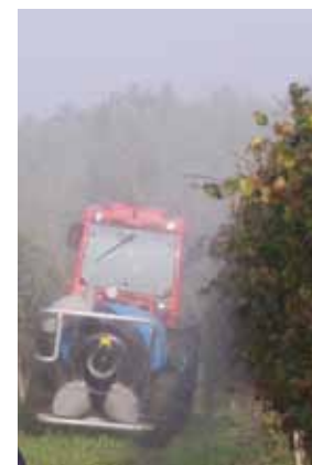
(G) - Atomizzatore basso volume per vigneti collinari (Rodano)