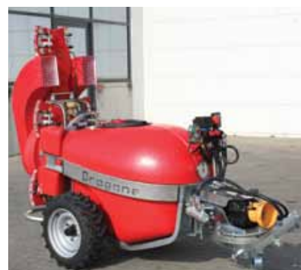
A destra macchina dotata di presa d'aria posizionata in alto (Dragone)