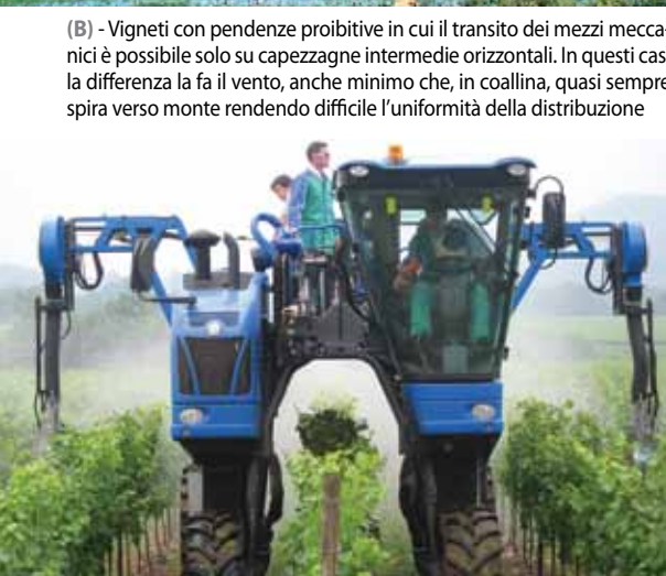
(B) - Vigneti con pendenze proibitive in cui il transito dei mezzi meccanici è possibile solo su capezzagne intermedie orizzontali. In questi casi la differenza la fa il vento, anche minimo che, in coalina, quasi sempre spira verso monte rendendo difficile l'uniformità della distribuzione