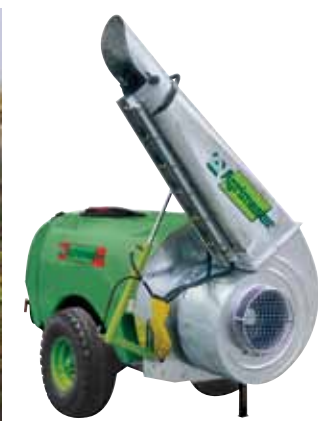
(H) - Mezzo specifico a lunga gittata (Agrimaster)