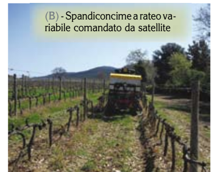
(B) - Spandiconcime a rateo variabile comandato da satellite

L'azoto è la base per produzioni abbondanti, impossibili in carenza di questo elemento. Risulta pertanto inutile stimolare la pianta a vegetare in modo esagerato, quando si vogliono produzioni normali (10 t/ha di uva) o addirittura molto contenute (5-8 t/ha), alle quali si