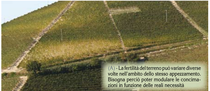
(A) - La fertilità del terreno può variare diverse volte nell'ambito dello stesso appezzamento. Bisogna perciò poter modulare le concimazioni in funzione delle reali necessità

È noto, ad esempio, che il Kober 5BB stimola la produzione di acidi organici, ma anche l'assorbimento di ione potassio, per cui le uve presentano una acidità titolabile sostenuta, ed un pH alto, fat-