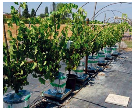
Foto A Alcune viti di Sangiovese in prova posizionate sulle bilance per la misurazione della traspirazione. Nella parte alta della foto è evidente la struttura a «V» che separa la chioma della forma aperta (A) in due pareti contrapposte. La chioma chiusa (C) è palizzata mediante due coppie di fili mobili

Quattro piante per ogni tesi sono state posizionate su altrettante bilance mod. LAUMAS (ABC Bilance, Campogalliano, IT) e collegate a un datalogger CR1000 in modo da registrare la variazione di massa a intervalli di 10 minuti per tutta la stagione. Per evitare perdite di acqua per evaporazione dal terreno, ogni vaso è stato schermato con un film plastico legato al tronco e opportunamente coperto con carta riflettente. In questo modo è stata calcolata la sola acqua persa dalle foglie per traspirazione in base alla differenza di peso tra la fine di un turno di irrigazione e l'inizio di quello successivo. Durante la stagione è stata inoltre