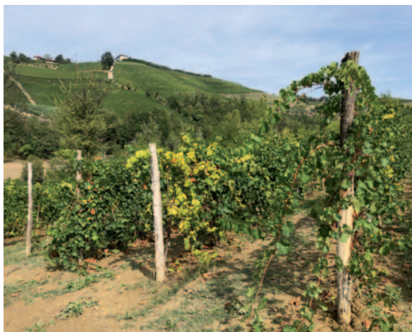
(D) - Pianta di vite sintomatica della varietà Chardonnay piantata nel vigneto sperimentale ad Alba (CN), presso l'Azienda Agricola Rigo.

Il piano sperimentale utilizzato in questo studio che includeva tre trattamenti (vettore infettivo, vettore sano e assenza di vettore) ha permesso di indagare per la prima volta la modulazione dell'espressione genica della vite elicitata dalla puntura di S. titanus infetti e sani e poi, in aggiunta, l'effetto indotto dal fitoplasma della FD nei primi stadi di infezione, permettendo quindi la dissezione dell'interazione pianta-patogeno-vettore a livello molecolare. In sintesi, in Chardonnay, a tre giorni dall'infezione, sono avvenuti ampi cambiamenti dei trascritti in risposta all'insetto sano, mentre la risposta di difesa a S. titanus infetto, risultante dall'interazione tra pianta-patogeno-insetto, è apparsa molto più limitata. In particolare, la chiara attivazione di diverse vie di trasduzione del segnale, osservata in risposta all'insetto sano, mediate dal calcio e da ormoni come l'acido jasmonico, non è più stata osservata dopo l'infezione di S. titanus infetti. Ciò significa che nella varietà suscettibile il fitoplasma della FD induce un'inibizione della via di difesa mediata dall'acido jasmonico, ga-