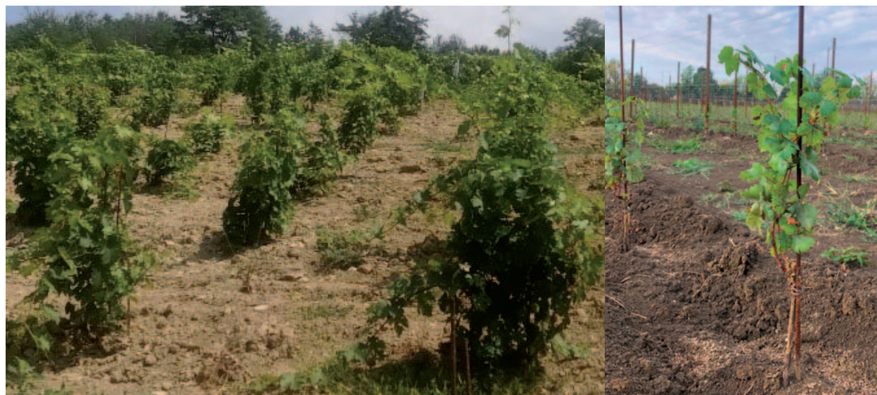
(E) - I vigneti sperimentali: a sinistra il vigneto piantato ad Alba (CN) presso l'Azienda Agricola Rigo, un anno dopo l'impianto del 2018; a destra il vigneto appena piantato a Conegliano (TV) presso la scuola enologica "G.B. Cerletti" (2021).

Il fitoplasma responsabile della malattia della FD, come gli altri fitoplasmi, non è coltivabile in laboratorio, ma so-