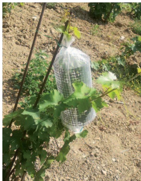
(F) - Infezione sperimentale in vigneto presso Alba (CN), ottenuto tramite il posizionamento di gabbie entomologiche contenenti il vettore e posizionati su tralci da infettare.

pravvive solamente all'interno di un ospite come il suo vettore, S. titanus , o una pianta come la vite. Per queste ragioni l'infezione delle viti in vigneto è stata effettuata in modo sperimentale controllato: il fitoplasma è stato inoculato tramite il suo vettore, che è stato lasciato prima nutrire su viti infette in condizioni controllate, quindi spostato all'interno di gabbie entomologiche predisposte sulle piante oggetto della sperimentazione, al fine di sottoporle ad infezione controllata (F). I sintomi della malattia in vigneto, che corrispondono alle capacità di reazione alla ma-