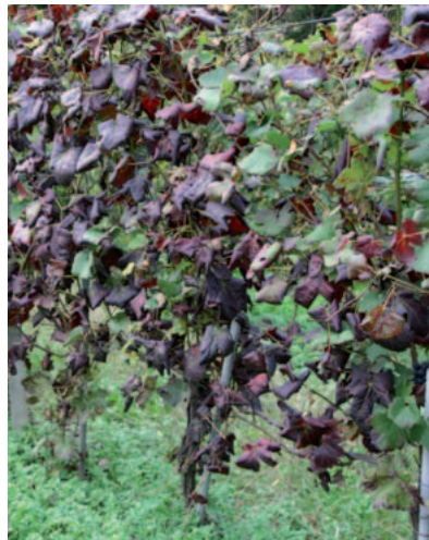
(A) - Sintomatologia tipica da fitoplasmosi su vitigno a bacca nera.

Il CREA Centro per la ricerca in Viticoltura ed Enologia ha eseguito ricerche sulla malattia della FD, la sua epidemiologia ed il suo controllo fin da quando la patologia è comparsa in Veneto nei primi anni '90. Fra le altre attività, un argomento importante su cui ci si focalizza è lo studio di eventuali varietà di vite resistenti, o perlomeno meno suscettibili alla FD, e le ragioni profonde di tali caratteristiche, con l'implementazione di studi genetici e genomici.