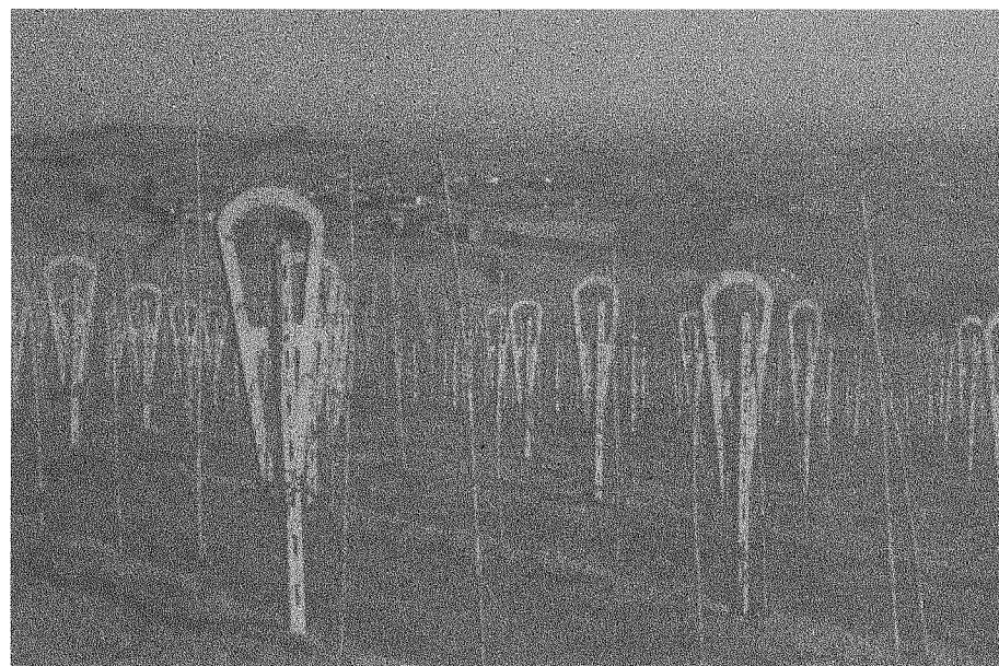
Fig. 3 - Intelaiatura atta a sopportare coppie di fili per facilitare il palizzamento in verde del vitigno "Nebbiolo".