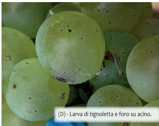
(D) - Larva di tignoletta e foro su acino.

visto una recrudescenza della malattia anche su varietà e/o in areali considerati poco interessati, si sta concentrando molto sugli interventi estintivi, da eseguirsi in pre o in post-raccolta immediata, con prodotti a basso rischio di insorgenza di resistenza, così da ridurre l'inoculo e rendere la difesa, nella stagione successiva, più efficace e allo stesso tempo meno aggressiva e dispendiosa. Anche su questo fronte i risultati sono stati estremamente interessanti. Su botrite l'attività sperimentale ha visto l'impiego di svariate soluzioni a basso impatto, con risultati molto interessanti, in particolare quando applicati in un contesto agronomico corretto. Per quanto riguarda la sperimentazione su Lobesia botrana (tignoletta della vite), negli ultimi anni questa attività ha visto un calo, a causa delle difficoltà delle multinazionali di sviluppare nuove soluzioni autorizzabili in Europa. Di conseguenza stiamo lavorando con nuove tipologie di confusione sessuale. Su cocciniglia farinosa l'attività di sperimentazione sta invece avendo un'intensificazione, anche a causa della fine ormai segnata dell'impiego di spirotetramat, insetticida di riferimento per il controllo di questo fitomizo.