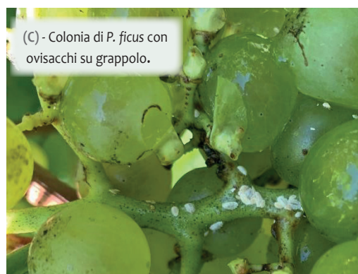
(C) - Colonia di P. ficus con ovisacchi su grappolo.

Come detto precedentemente su vite si lavora per lo più per impostare biostimolanti e prodotti a basso impatto ambientale. In particolare su peronospora si è investigata l'attività di estratti vegetali e formulati a basso contenuto di rame. In questo contesto i risultati ottenuti sono stati finora parzialmente soddisfacenti, per lo meno nelle condizioni di elevata pressione di malattia che si verificano nei nostri areali di produzione. Su oidio si sono sperimentati molti dei