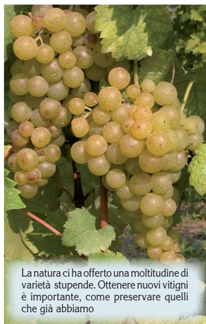
La natura ci ha offerto una moltitudine di varietà stupende. Ottenere nuovi vitigni è importante, come preservare quelli che già abbiamo

Anche in questo caso il metodo di ottenimento è l'ibridazione, che ha dato risultati molto concreti, visto che la quasi totalità della viticoltura mondiale utilizza il portinnesto, che permette alla pianta di resistere ai danni da fillossera, di adattarsi ai terreni e di regolare la vigoria.