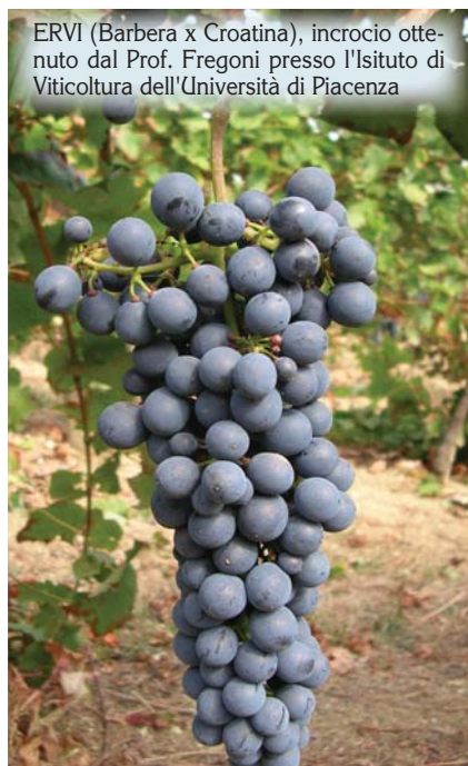
ERVI (Barbera x Croatina), incrocio ottenuto dal Prof. Fregoni presso l'Istituto di Viticoltura dell'Università di Piacenza

trite e la costanza di produzione, e dal punto di vista enologico per la sua rotondità, giusta acidità, buona struttura, colore intenso e aromi fruttati e speziati, che si sta diffondendo nel piacentino; potrà diventare un ottimo vitigno miglioratore del Gutturnio.