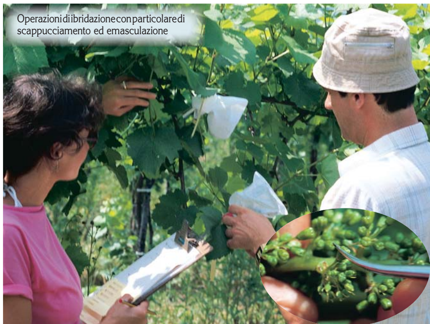
Operazioni di ibridazione con particolare di scappucciamento ed emasculazione

Con l'incrocio (unione di due vitigni, un padre ed una madre, appartenenti alla stessa specie, in genere la V. vinifera ) si ottengono nuove varietà che rispondono alle esigenze riportate nell'introduzione di questo articolo. Il loro successo commerciale è tangibile per le uve da tavola (es. Italia, Victoria, Matilde, Red Globe, ecc.), più problematico per le uve da vino, almeno finora, ma in futuro potremo avere delle piacevoli sorprese. In tab. 1 sono riportati alcuni incroci da vino, di un certo interesse, ottenuti in Italia. Tra questi vorrei enfatizzare l'ERVI (Barbera x Croatina), molto interessante da un punto di vista viticolo per la sua vigoria contenuta, la buona tolleranza alla bo-