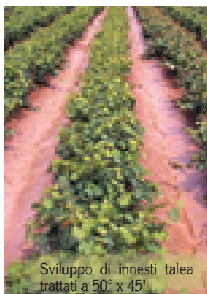
Sviluppo di innesti talea trattati a 50° x 45'