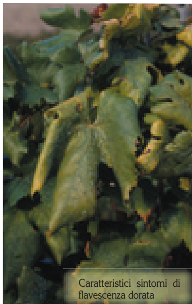
Caratteristici sintomi di flavescenza dorata

iniziale dell'infezione nei vigneti di nuovo impianto contribuendo così ad aggravare il problema. L'enorme lavoro di prevenzione svolto negli ultimi anni dal Servizio Fitosanitario della Regione Piemonte, finalizzato al controllo capillare dei vigneti di piante madri e dei barbatellai utilizza-