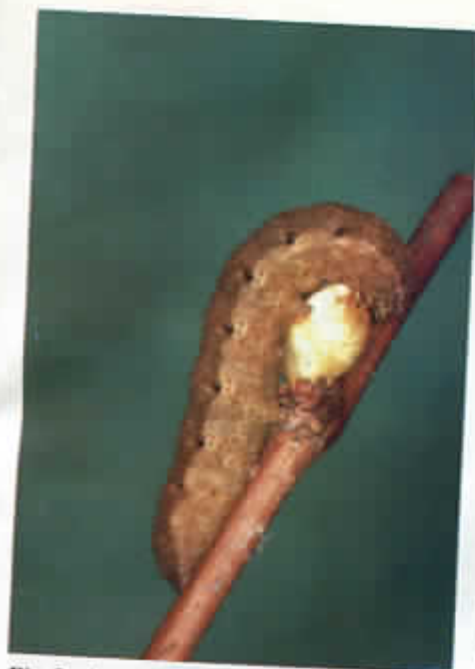
Fig. 2 - Larva di nottuide in attività trofica su gemma di vite.