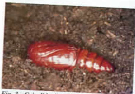
Fig. 3 - Crisalide di nottuide sul terreno.

determinano le imprevedibili saltuarie fluttuazioni.