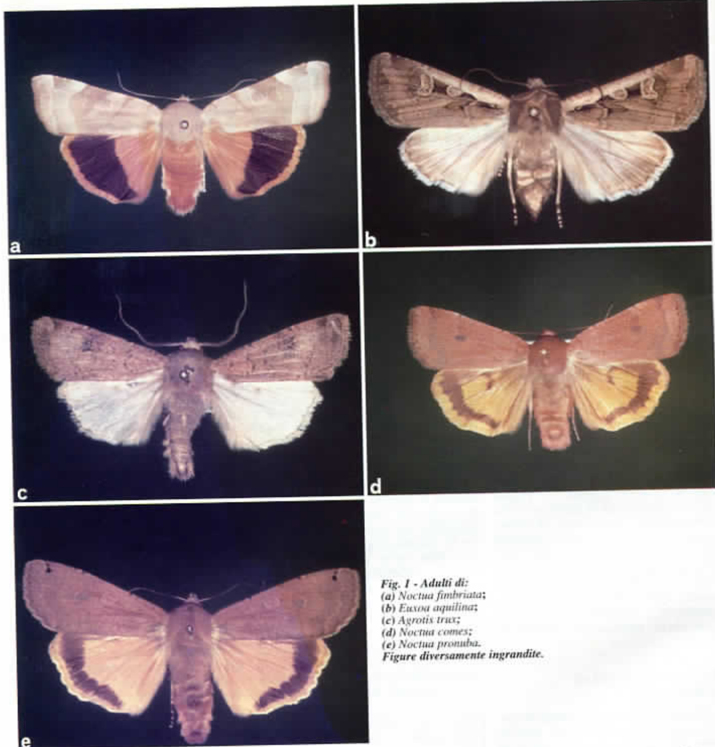
Fig. 1 - Adulti di: (a) Noctua fimbriata ; (b) Euxoa aquilina ; (c) Agrotis trux ; (d) Noctua comes ; (e) Noctua pronuba . Figure diversamente ingrandite.

La pericolosità degli attacchi è risultata strettamente legata alla velocità di accrescimento dei germogli, velocità che viene rallentata da improvvisi abbassamenti di temperatura e da periodi piovosi. Con queste condizioni climatiche le larve più giovani hanno a disposizione un tempo maggiore per effettuare erosioni a carico delle gemme, e quindi per provocare danni pesanti alla produzione, prima che l'allungamento dei getti le costringa ad apportare alterazioni sol-