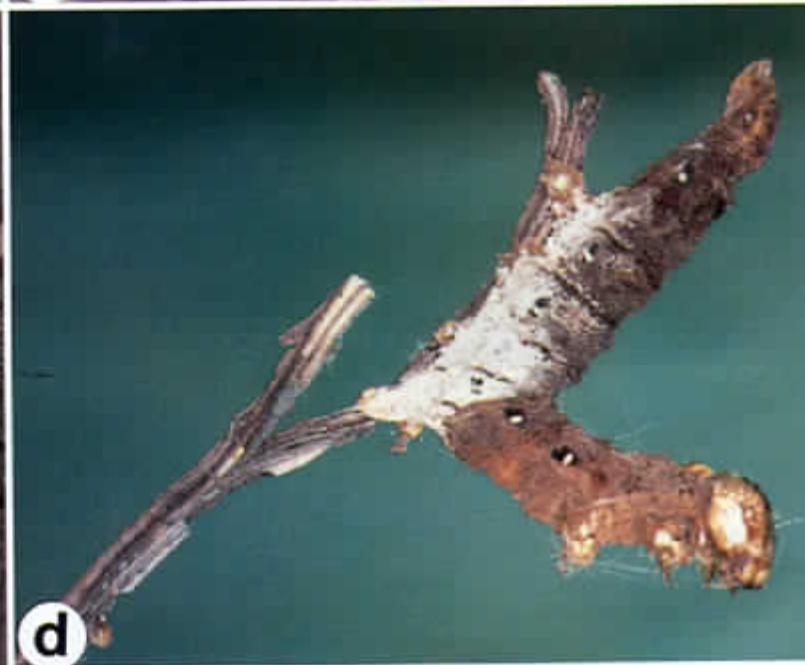
Fig. 5 - (a) Linnaemyia picta (adulto); (b) Diphysus quadripunctorius (maschio); (c) bozzoli di braconide su larva di nottuidae; (d) larva di nottuidae bloccata da funghi entomopatogeni.

risultati, è necessario ricordare che tali applicazioni sono molto onerose e debbono venire effettuate con grande attenzione, per bagnare accuratamente ceppo e capo a frutto. Inoltre, in caso di notevoli abbassamenti di temperatura, quando le larve rimangono nei loro ricoveri per più notti senza salire sui tralci a cibarsi, il prodotto può perdere gran parte della sua efficacia. La soglia di intervento può essere fissata con attacchi alle gemme superiori a 2-3%, corrispondente a una perdita di uva tale da giustificare il costo di un trattamento. Merita comunque ricordare che attualmente in