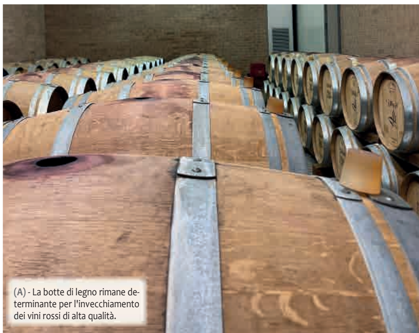
(A) - La botte di legno rimane determinante per l'invecchiamento dei vini rossi di alta qualità.

composti fenolici e volatili è molto più rapido (Bautista-Ortínet et al., 2008; Martínez-Gil et al., 2020) e dipende da diversi fattori, quali il rapporto "quantità di trucioli/volume di vino", il tempo di contatto, il livello di tostatura, la dimensione e la forma dei trucioli (Garde-Cerdán et al., 2006; Koussissi et al., 2020). Ovviamente, in questo affinamento alternativo viene a mancare la componente "microossigenazione", tuttavia piccole e controllate quantità di ossigeno possono essere fornite al