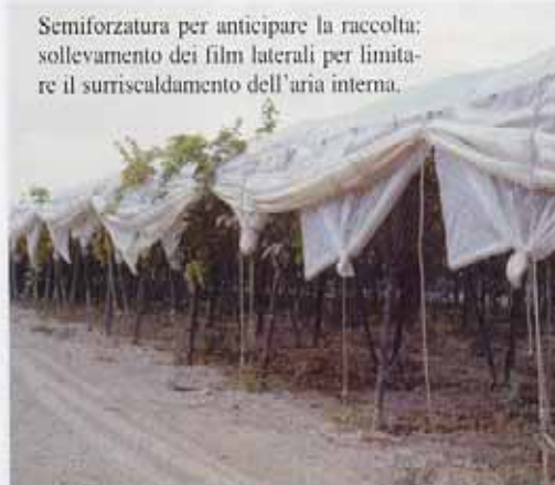
Semiforzatura per anticipare la raccolta: sollevamento dei film laterali per limitare il surriscaldamento dell'aria interna.

L'apprestamento protettivo può rimanere chiuso finché la temperatura interna diviene prossima a 30 °C.