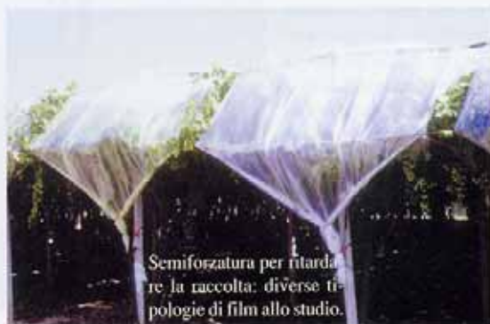
Semiforzatura per ritardare la raccolta: diverse tipologie di film allo studio.

Tuttavia, contrariamente a quanto generalmente ritenuto in relazione a questo tipo di semiforzatura, la presenza del film plastico risulta non agire come semplice protezione meccanica dalla pioggia. La sua presenza, cui si aggiunge quella della rete antigrandine, può infatti indurre sensibili variazioni microambientali, come ad esempio ridurre del 30-40 % la radiazione foto-