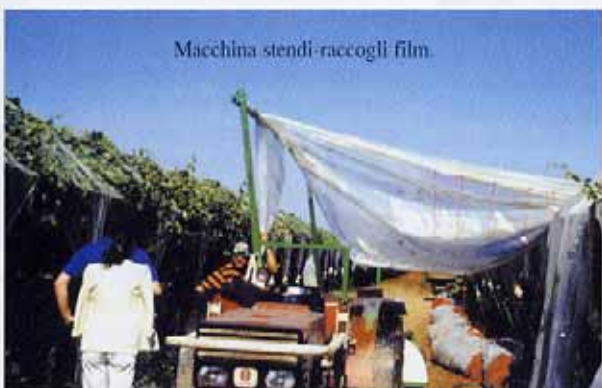
Macchina stendi-raccogli film.

riemessa dal suolo e dai corpi solidi sotto forma di IR lungo. Maggiore è l'incremento termico nell'ambiente confinato, più precoce risulta il germogliamento e quindi anche la maturazione. La precocità di germogliamento può variare tra 10 e 40 giorni in funzione della coltura, delle caratteristiche radiometriche del film plastico,