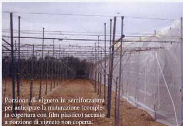
Porzione di vigneto in semiforzatura per anticipare la maturazione (completa copertura con film plastico) accanto a porzione di vigneto non coperta.

presenza della copertura plastica, la continuità della protezione del vigneto nel corso dell'intera stagione vegetativa è generalmente affidata a reti antigrandine; anch'esse, in funzione del colore e dalla fittezza delle maglie, riducono il flusso di radiazione solare che raggiunge la vegetazione. Le reti più diffuse in Italia sono bianche, con effetto ombreggiante massimo del 20 %.