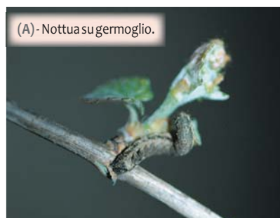
(A) - Nottua su germoglio.

Le larve di questi lepidotteri agiscono principalmente nelle ore notturne o crepuscolari, risalendo lungo la pianta per svolgere la propria attività trofica a carico della vite (A).