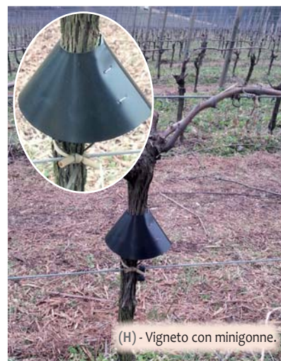
(H) - Vigneto con minigonne.

Consigli: conviene limitare l'applicazione su viti adulte perché il diametro del fusto delle viti giovani aumenta rapidamente.