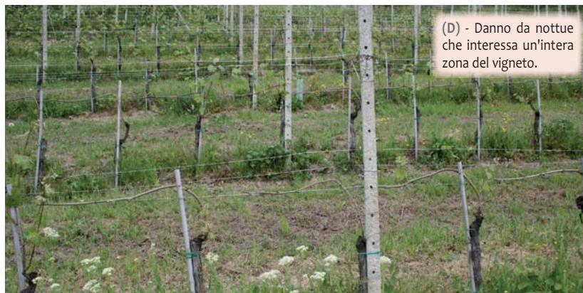
(D) - Danno da nottue che interessa un'intera zona del vigneto.