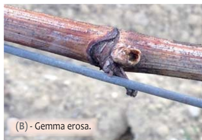
(B) - Gemma erosa.

Le larve svernanti provengono da uova deposte su piante avventizie durante il periodo estivo. Queste trascorrono l'inverno a differenti stadi nel terreno, riparati tra i residui vegetali. Le soglie termiche che permettono lo sviluppo di queste specie sono piuttosto basse, tanto che, intorno a 3 - 6 °C le larve riprendono la loro attività consumando preferibilmente graminacee o altre essenze erbacee. La rosura dei germogli della vite rappresenta per le nottue un alimento secondario ed occasionale, seppure la loro voracità possa provocare ingenti danni in situazioni particolari.