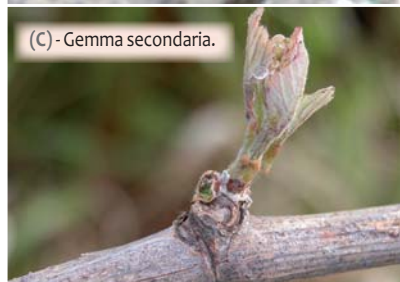
(C) - Gemma secondaria.