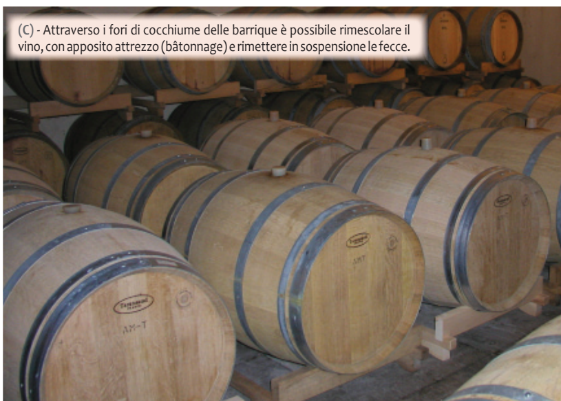
(C) - Attraverso i fori di cocchiume delle barrique è possibile rimescolare il vino, con apposito attrezzo (bâtonnage) e rimettere in sospensione le fecce.

I fattori in gioco sono molti e probabilmente al momento attuale non tutti sono noti, le indicazioni che ci possono aiutare sono in continua evoluzione, ciò ci permette di essere sempre più performanti e ci aiuta a gestire meglio anche questa seconda fermentazione.