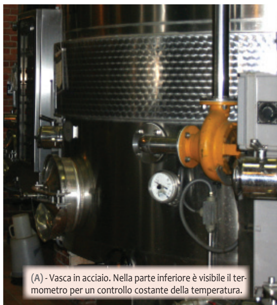
(A) - Vasca in acciaio. Nella parte inferiore è visibile il termometro per un controllo costante della temperatura.

Il primo fattore da prendere in considerazione è l'alcool etilico che, vista la sua struttura bipolare, tende ad interferire con la struttura fluida della membrana. L'etanolo induce una maggiore rigidità nello strato idrofilo esterno della membrana ed una eccessiva fluidificazione del suo strato idrofobo