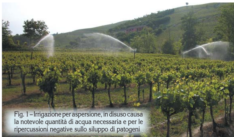
Fig. 1 – Irrigazione per aspersione, in disuso causa la notevole quantità di acqua necessaria e per le ripercussioni negative sullo sviluppo di patogeni

E' noto come il ciclo vegetativo della vite e la maturazione dell'uva siano fortemente influenzati dall'ambiente di coltivazione e dal regime idrico. Questo dipende dalla capacità dei suoli di trattenere l'acqua, dalle condizioni climatiche (radiazione solare, pioggia, temperatura, evapotraspirazione) e dall'architettura del vigneto. In particolare il consumo idrico è strettamente correlato all'energia solare incidente sulla superficie fogliare, pertanto l'utilizzo quotidiano di acqua da parte delle viti segue più strettamente il corso giornaliero della radiazione solare netta rispetto a quello della temperatura. Altri fattori ambientali che influenzano le perdite di acqua per traspirazione sono il vento e il deficit della pressione di vapore (al diminuire dell'umidità relativa, aumenta il deficit della pressione di vapore), oltre ai fattori colturali (fase fenologica, superficie fogliare, varietà e portinnesto, presenza di inerbiamento).