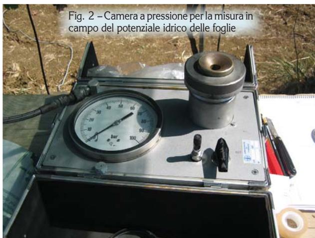
Fig. 2 – Camera a pressione per la misura in campo del potenziale idrico delle foglie