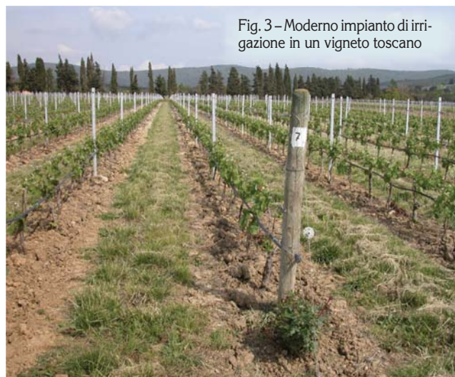
Fig. 3 - Moderno impianto di irrigazione in un vigneto toscano

Si possono imporre alle piante leggeri stress idrici nella fase