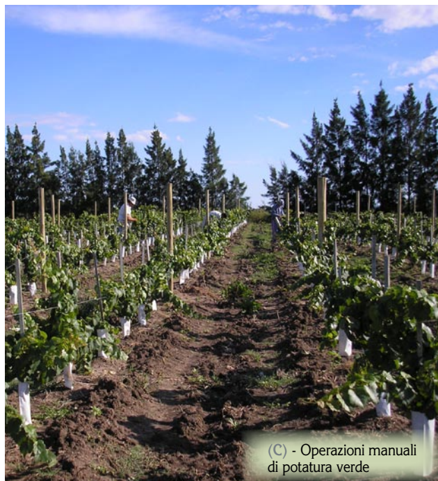
(C) - Operazioni manuali di potatura verde

L'uva prodotta è stata per circa il 75% oggetto di vendita a proprietari di cantine